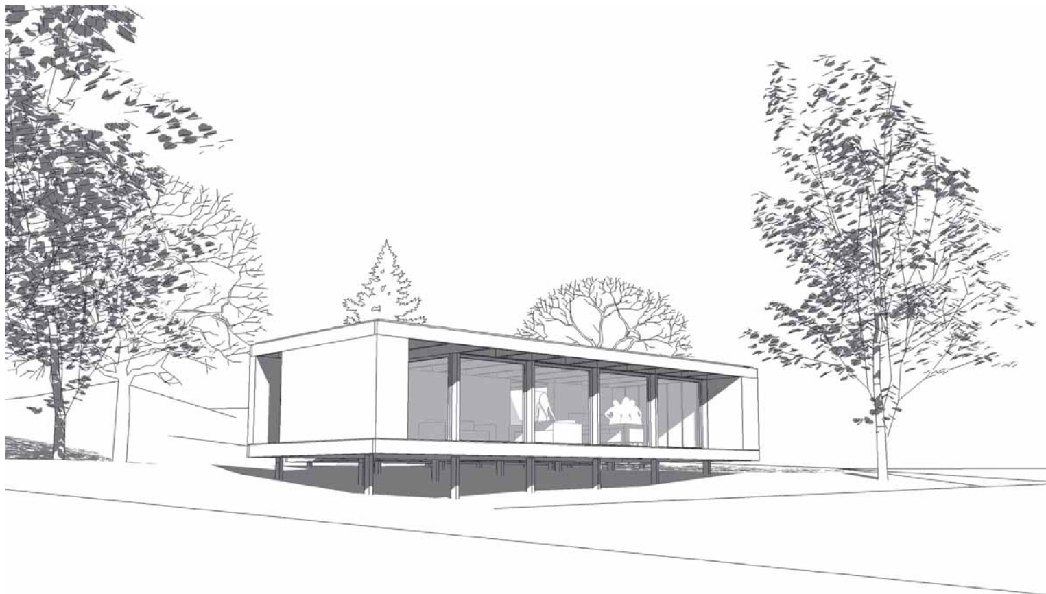
A montagem deste tipo de casas, em espaços verdes e de lazer tem sido muito bem acolhida

Assim, tendo como base comum o módulo, este sistema permite desenvolver as mais di-